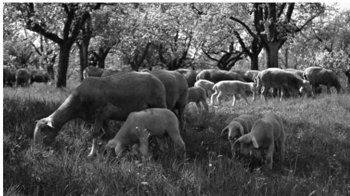
Den Schafen des Freilichtmuseums Beuren geht es an den Schäfertagen am 20. und 21. April an die Wolle.

Freilichtmuseum Beuren, Museum des Landkreises Esslingen für ländliche Kultur, In den Herbstwiesen, 72660 Beuren, www.freilichtmuseum-beuren.de , Info-Telefon 0711 3902-41890, info@freilichtmuseum-beuren.de . Öffnungszeiten: bis 3. November, Dienstag bis Sonntag 9 bis 18 Uhr sowie an Feiertagen.