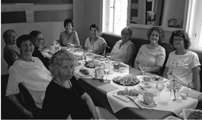
Das Betreuerinnenteam freut sich über Verstärkung

Jederzeit per Email: info@soziales-netz-weilheim.de