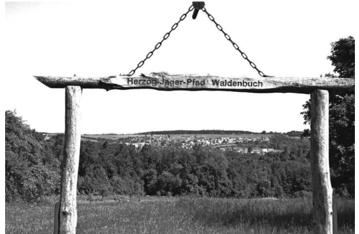
Blick auf Waldenbuch

Anmeldung unter Gerhard.Hepperle@t-online.de oder 07023-4856 bis Samstag, 24. Februar 2024.