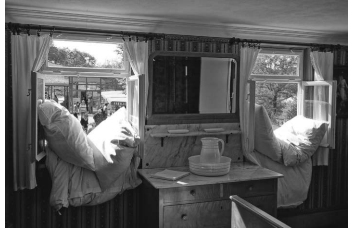
Die Bettdecken sind ausgelüftet, das Museumsdorf erwacht zu neuem Leben.

Freilichtmuseum Beuren, Museum des Landkreises Esslingen für ländliche Kultur, In den Herbstwiesen, 72660 Beuren, www.freilichtmuseum-beuren.de , Info-Telefon 0711 3902-41890, info@freilichtmuseum-beuren.de . Öffnungszeiten: 24. März bis 3. November, Dienstag bis Sonntag 9 bis 18 Uhr sowie an Feiertagen.